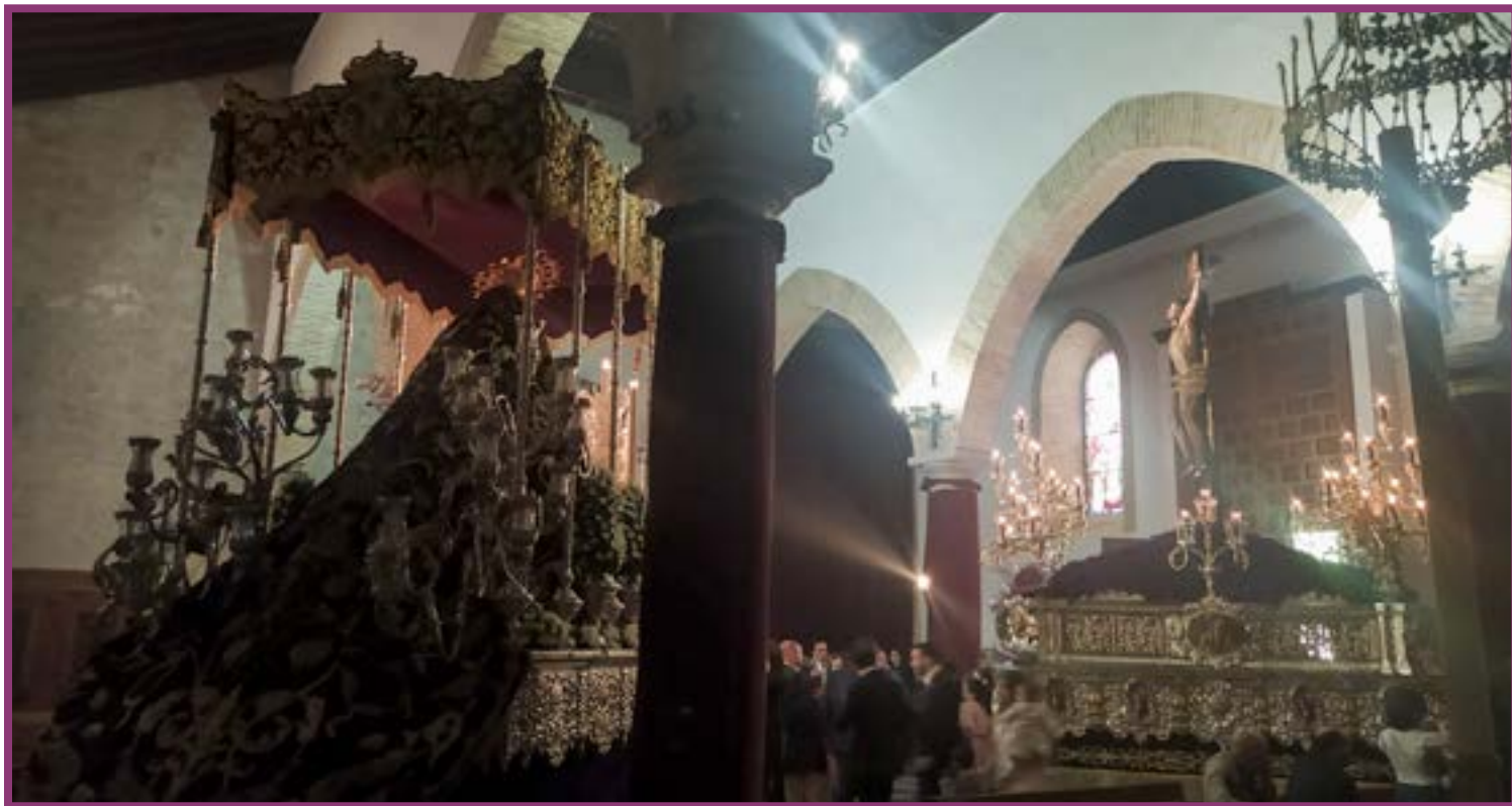
Mañana de un Jueves Santo atravesada por una luz radiante y esclarecedora...

Nuestras cofradías y hermandades están obligadas a funcionar como un antídoto a todo este festival de la confusión, pues tienen en sus manos, bien por la tradición o por la atracción de sus imágenes devocionales, como el Santísimo Cristo de la Expiración y María Santísima de las Siete Palabras, la capacidad de llevar, como a aquel muchacho le llevó la búsqueda de un amigo, a la Iglesia, donde espera Cristo Vivo y Real en el Santísimo Sacramento y salgan inundados por su luz radiante y esclarecedora y puedan llegar a ser fieles seguidores de Nuestro dulce Jesús de la Expiración.