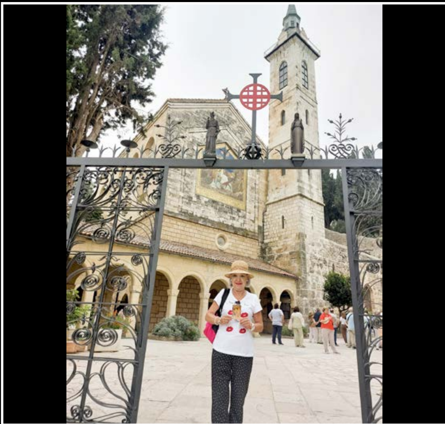
Ain Karem Visitación de la Virgen María a su prima Isabel