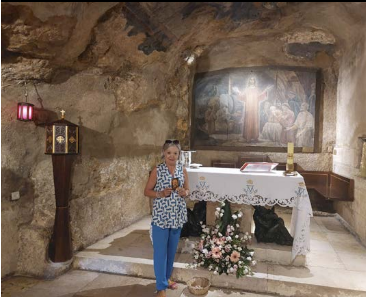
Gruta de la traición o del prendimiento Getsemaní