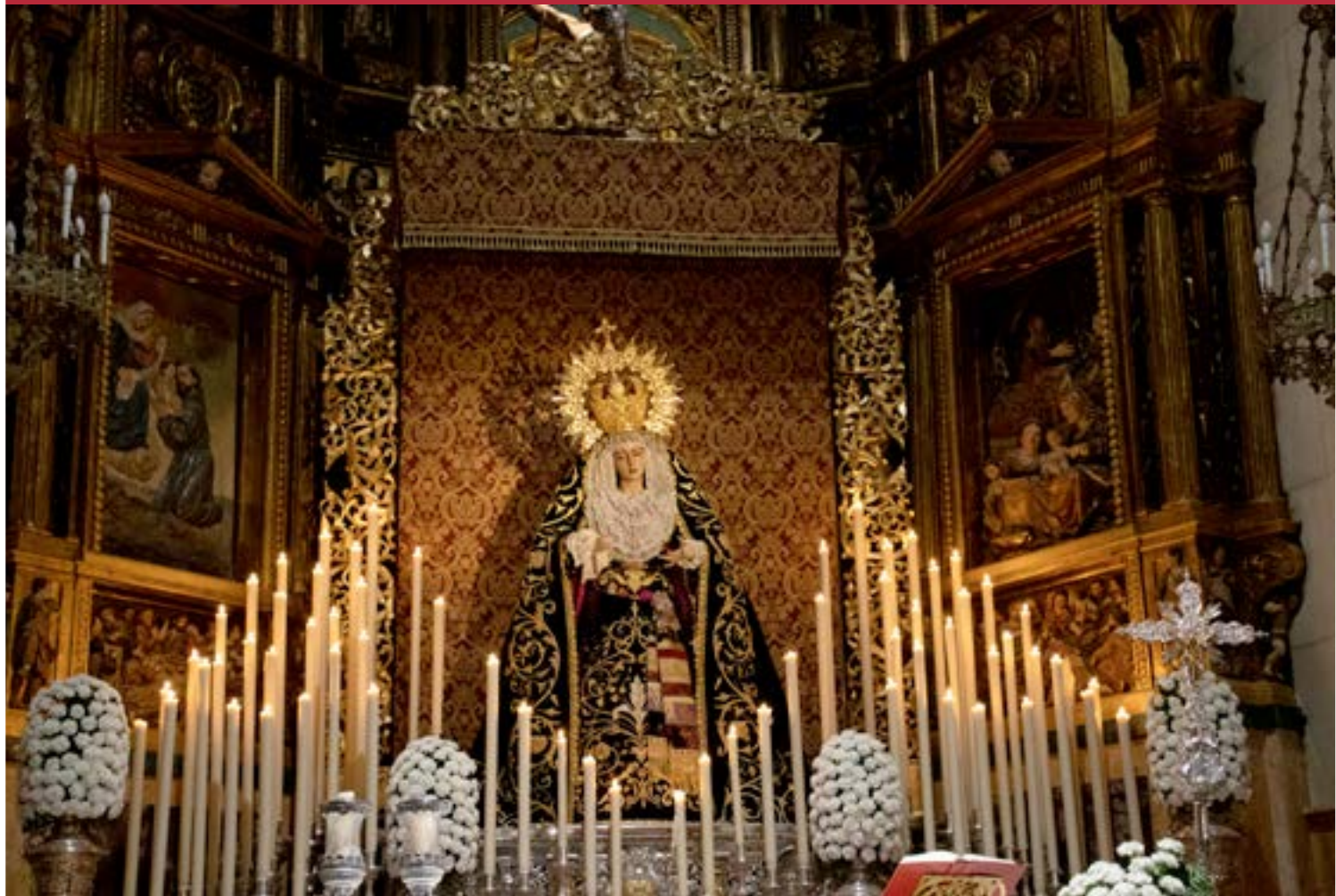
Triduo celebrado el tercer fin de semana del mes de noviembre