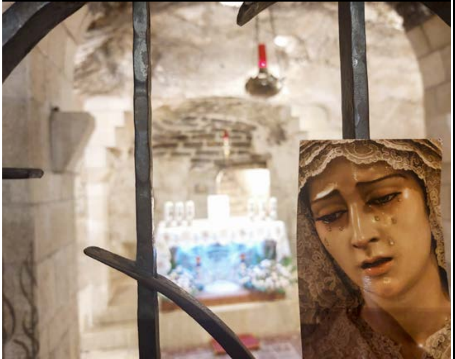
Nazaret. Iglesia de la Anunciación