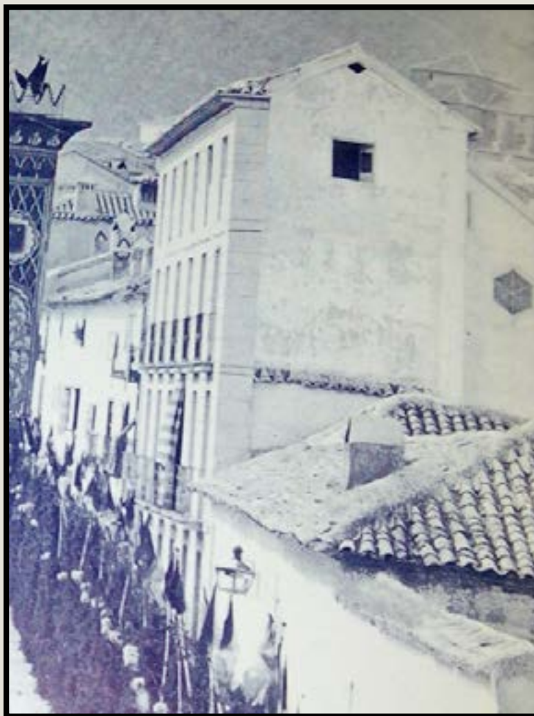
Edificio Económica 1862 Visita Reina Isabel II