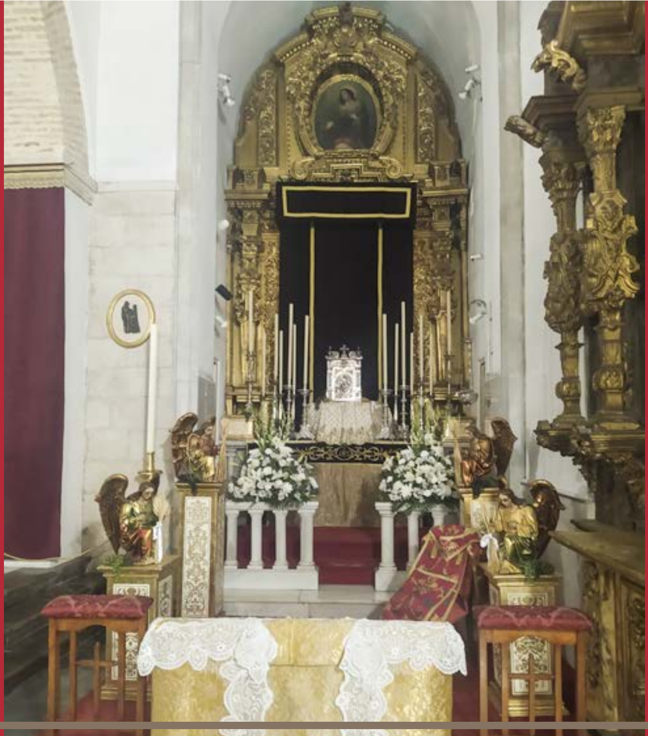
ALTAR PARA LA RESERVA EUCARÍSTICA DEL JUEVES SANTO