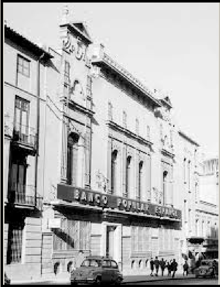
Real Sociedad Económica de Amigos del País

En su amplio círculo de relaciones e influencias sociales, siempre tuvo a gala propagar la vida cofrade y exaltar los fervores que despertaba el Cristo de la Expiración. La cofradía quiso agradecer sus desvelos cofrades de alguna manera y por ello le designó, el 17 de febrero de 1951, Gobernador Honorario. Correspondiendo a tal distinción, durante muchos años hizo el recorrido procesional del Jueves Santo integrando la presidencia de la procesión en compañía de un grupo de Ilus-