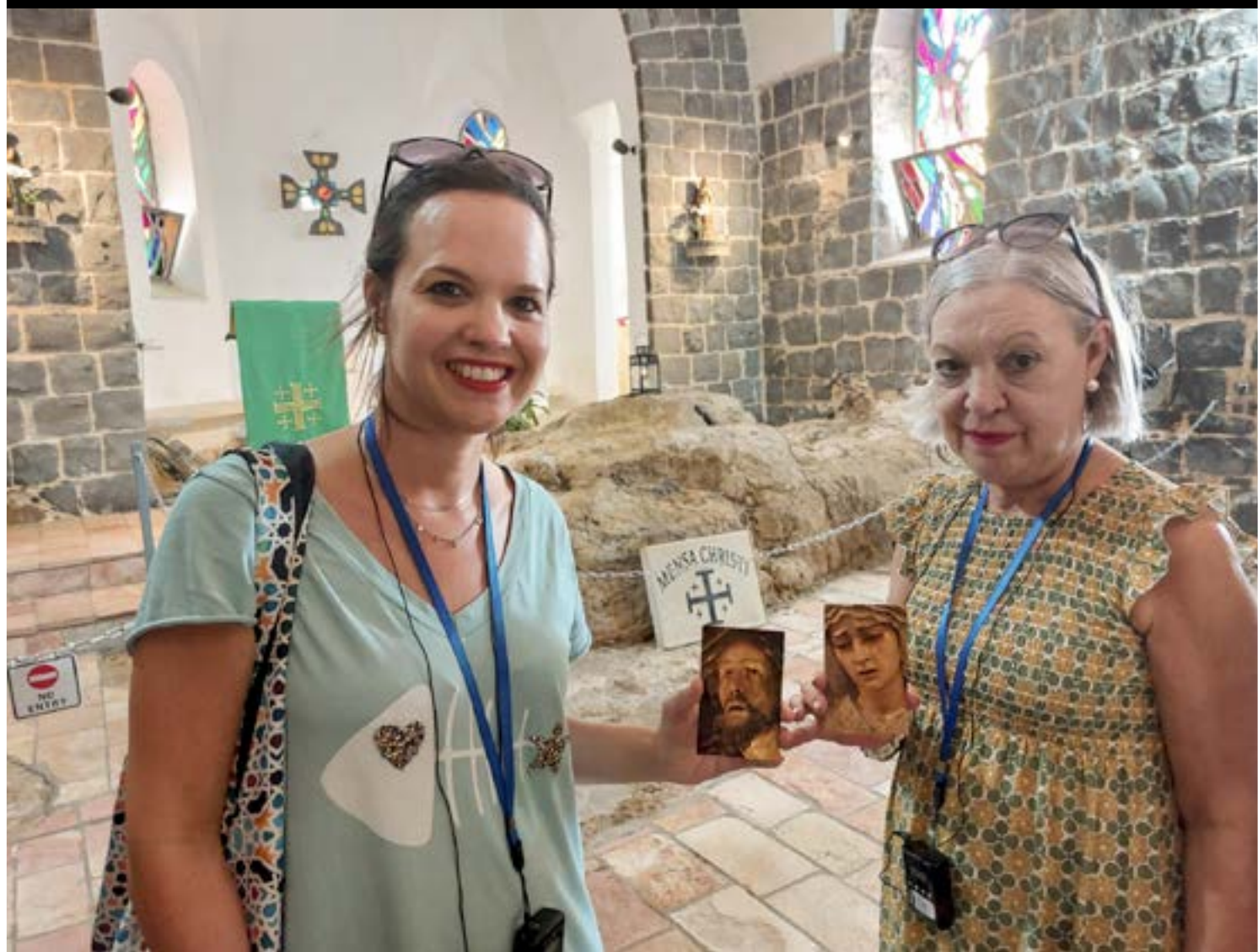
Iglesia del primado d Pedro. Cafarnaum