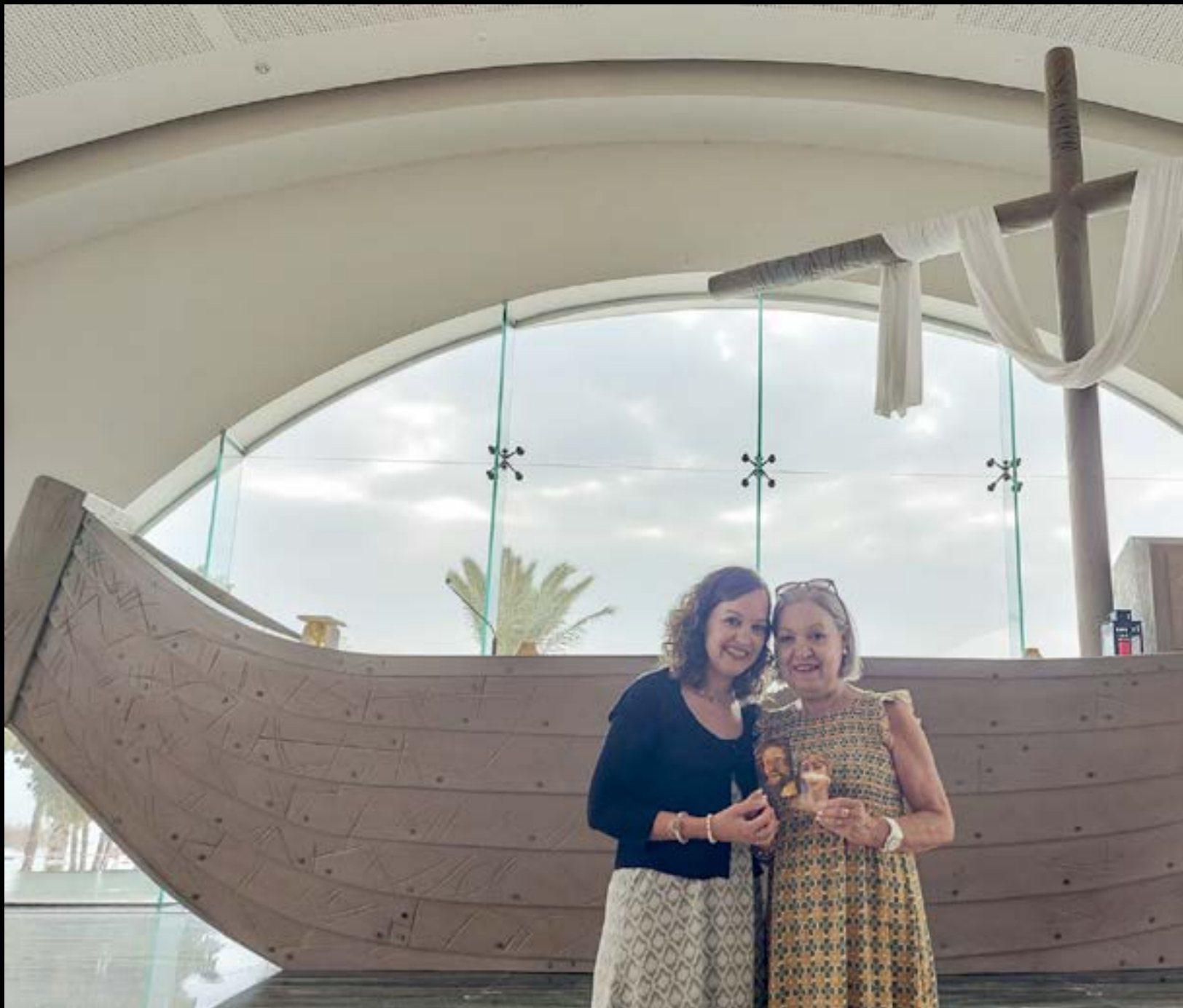
Foto: Mar de Galilea, lago Tiberíades o mar de Genesaret